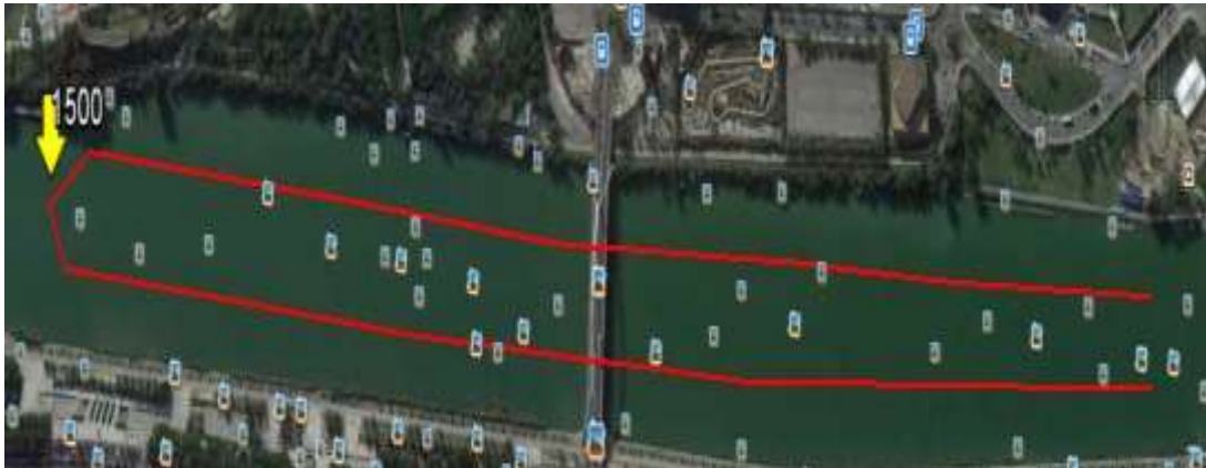
Recorrido: 2 vueltas a un circuito 3000m